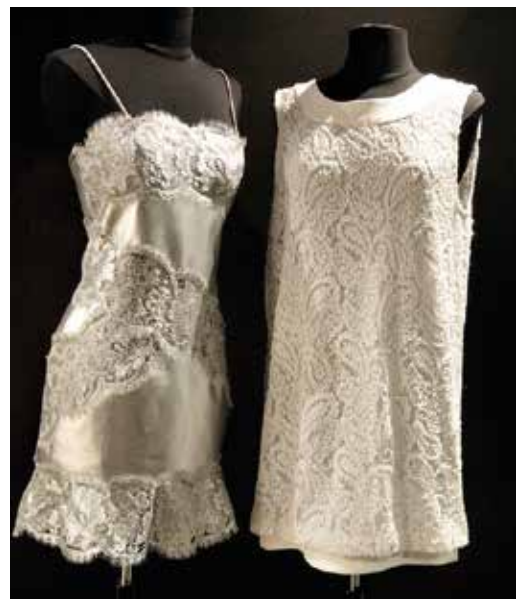
Pour une de ses expositions, Olivier Pétigny n'a pas hésité à imaginer que des danseurs se meuvent au son des machines de fabrication de dentelle.

Les dentelles y trouvaient la part belle ; étoffes sensuelles de prédilection, elles lui offrent la possibilité de jouer avec les dessus-dessous et tous les codes de la féminité. Une exposition au musée des dentelles et broderies de Caudry en 2010 (voir aussi sur cette page) illustrera ce